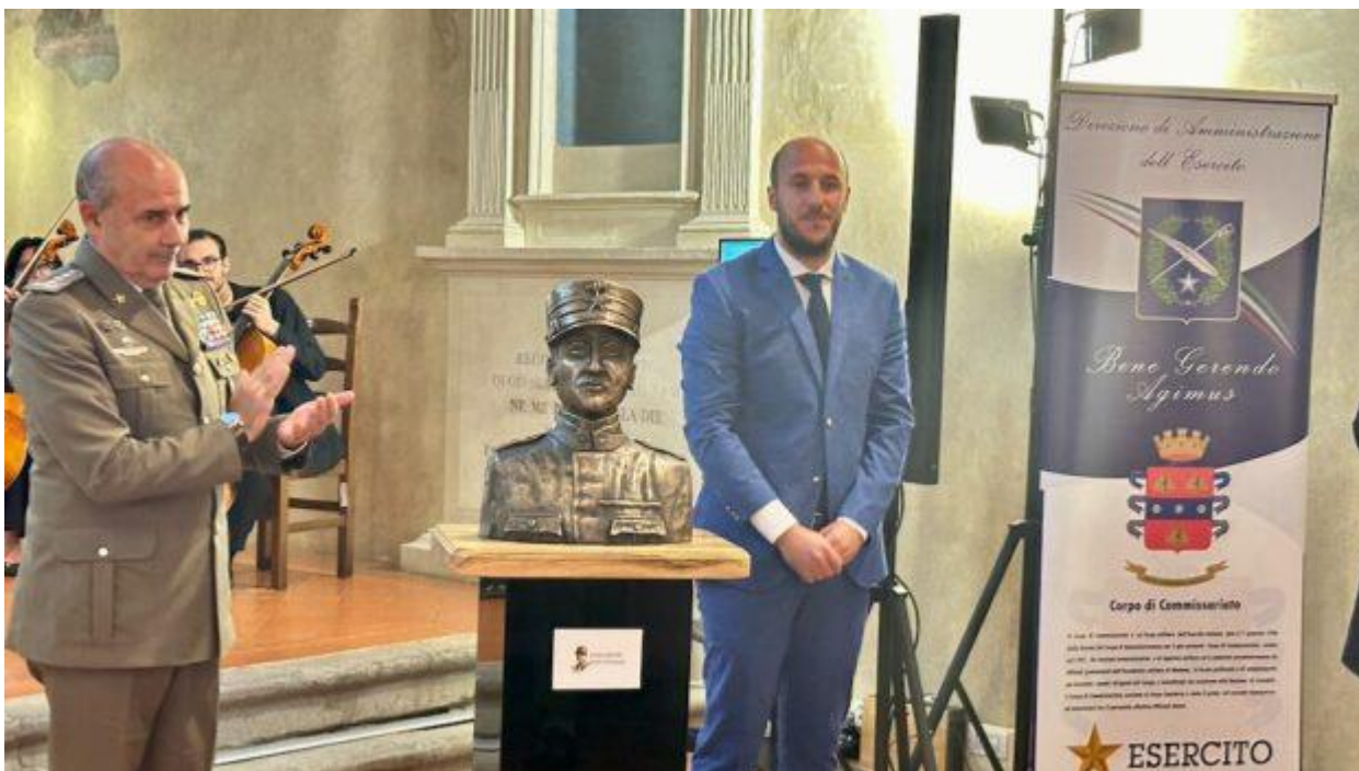
Il busto bronzeo di Oreste Salomone realizzato dallo scultore Domenico Rispoli